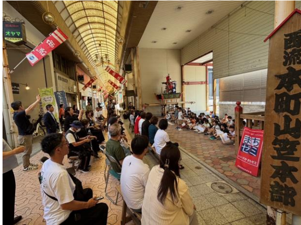
たくさんの保護者も商店街へ