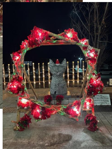
【参考】 風の涼音通り by シルバー (夏)